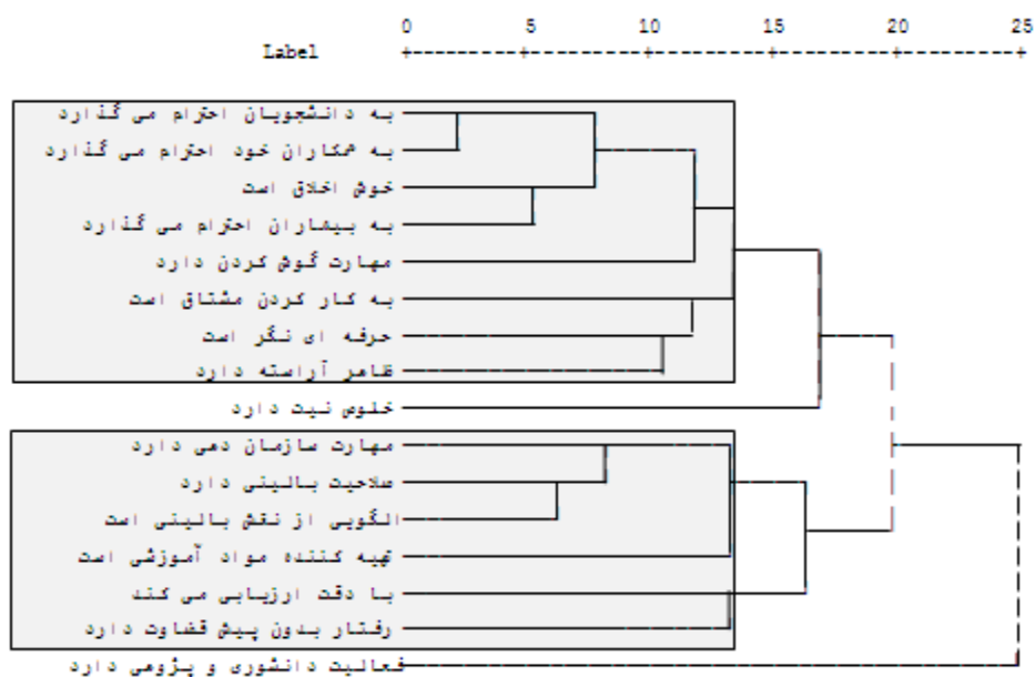
نمودار شمای ۲: نمودار dendrogram همبستگی و رابطه بین ویژگی های یک مدرس بالینی اثربخش

«متوسط» می دانستند. این در حالی است که بیش از نیمی از آنان تصمیم داشتند تا در آینده ادامه تحصیل دهند. در رابطه با ویژگی های شخصیتی دانشجویان، بیشترین نمره میانگین را ویژگی «به بیماران و پرسنل بهداشتی- درمانی احترام می گذارم» و کمترین نمره را ویژگی «دانش پرستاری خوبی دارم» به خود اختصاص داد.