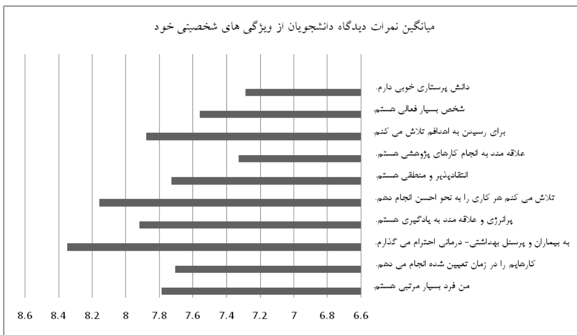
نمودار شماره ۱: میانگین نمرات دیدگاه دانشجویان از ویژگی‌های شخصیتی خود